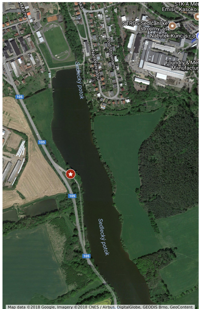
Závodní úsek s vyznačením místa prezentace

Pro závodníky bez přihlášky budou k dispozici místa až do naplnění kapacity závodu.